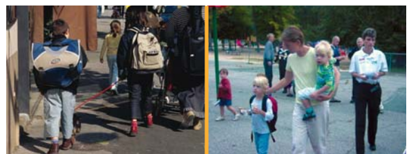
Chapel Hill, Caroline du Nord, USA.

De plus, cela met « une voiture dans la tête » de nos enfants qui n'apprennent plus à se déplacer autrement.